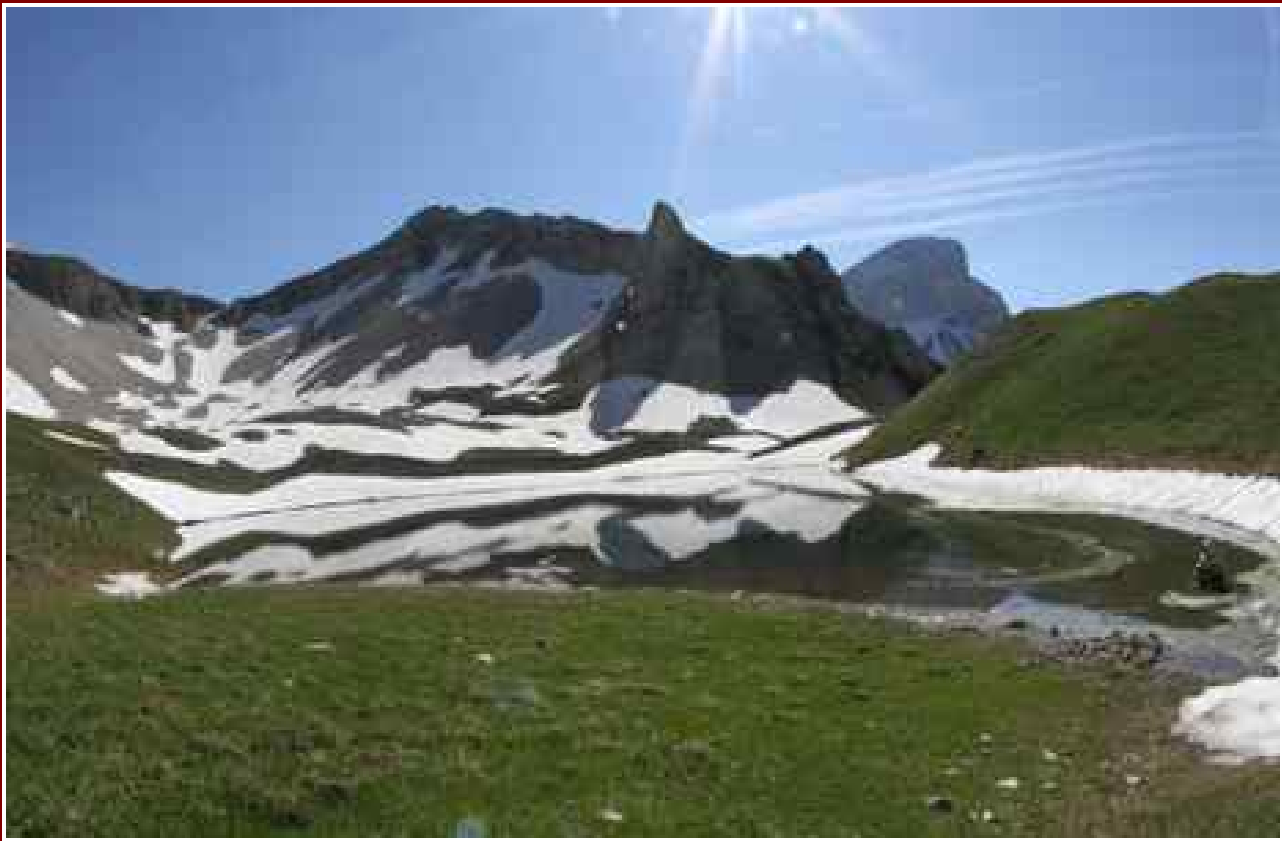
Le lac à 1953 m