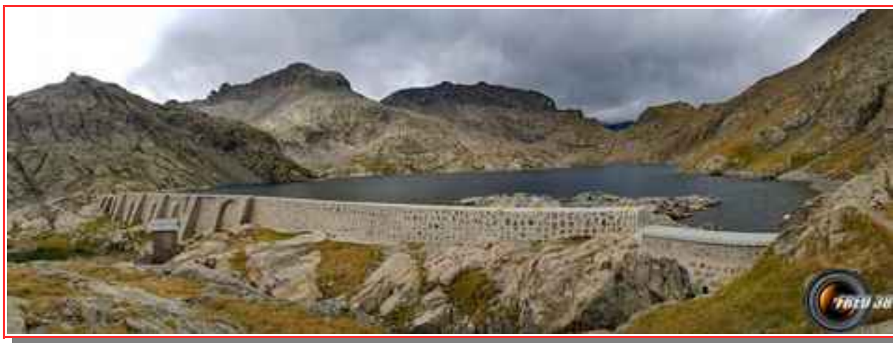
Le barrage du lac.

Itinéraire 10 km (A/R), 700 m de dénivelé.