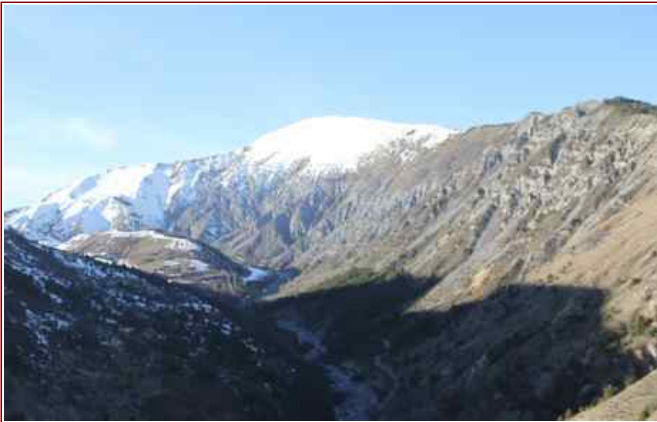
La Laupie vue du « Château ».

MASSIF : Pré-Alpes de Haute Provence CARTE : IGN 3439 ET