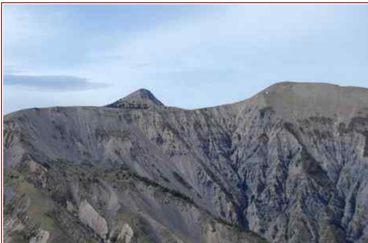
La Laupie à droite