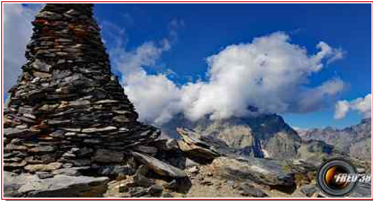
Vue du sommet sur Pelvoux.