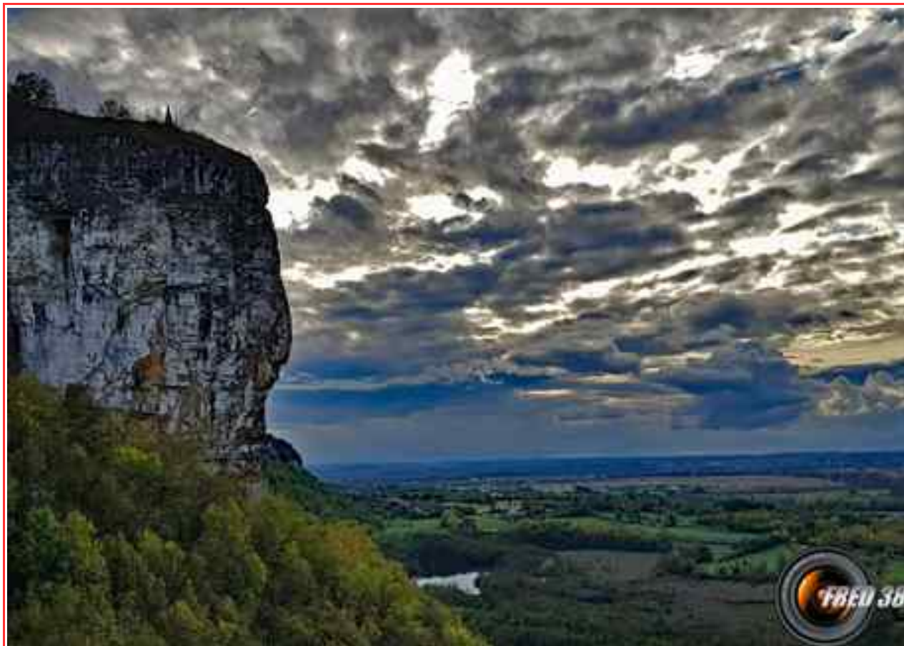
Le belvédère vu de la descente sur Hières-sur-Amby.