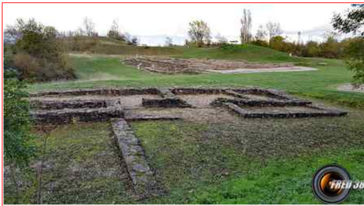
Le site de Larina.

Itinéraire 6 km en boucle dénivelé 300 m.