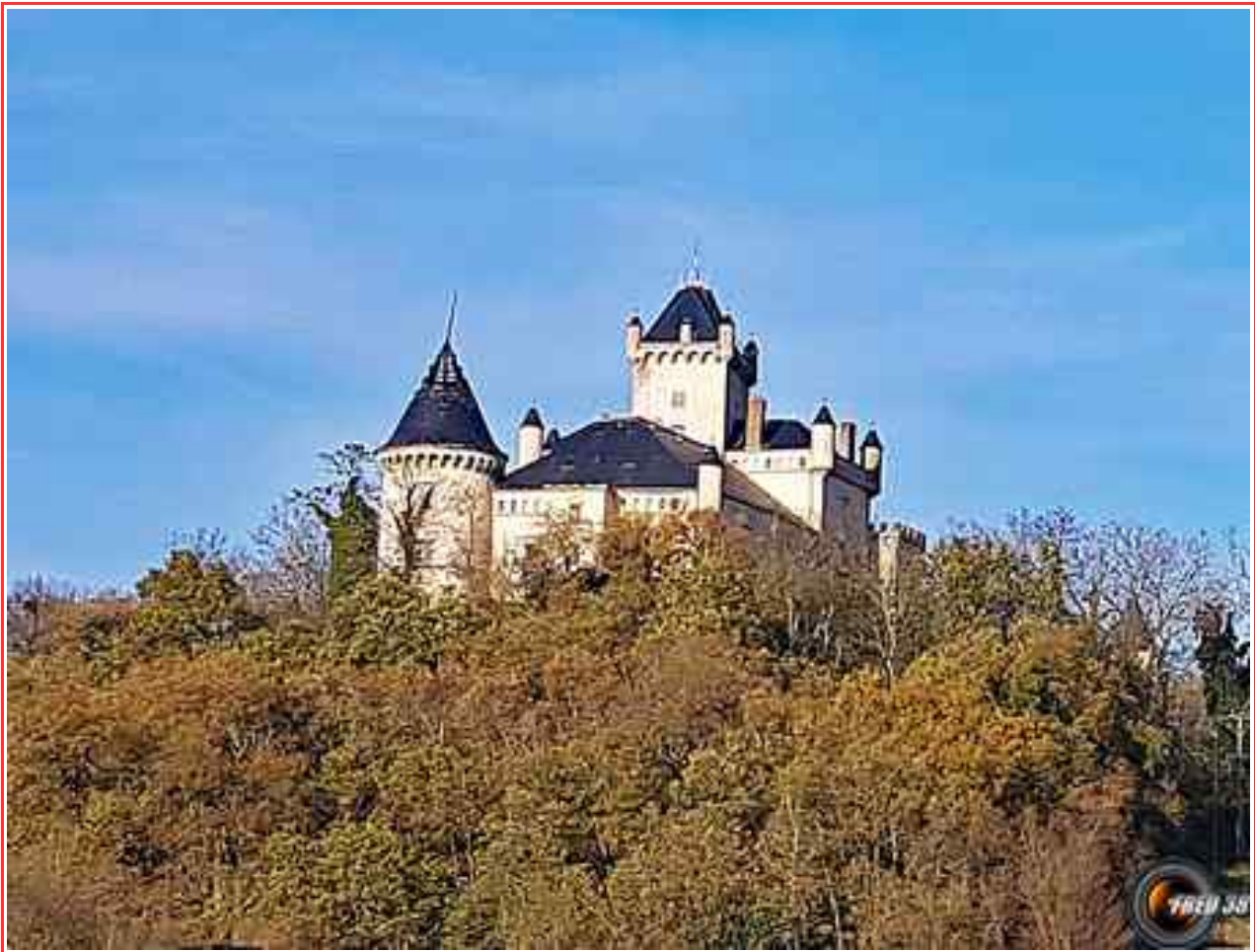
Château de Ry.