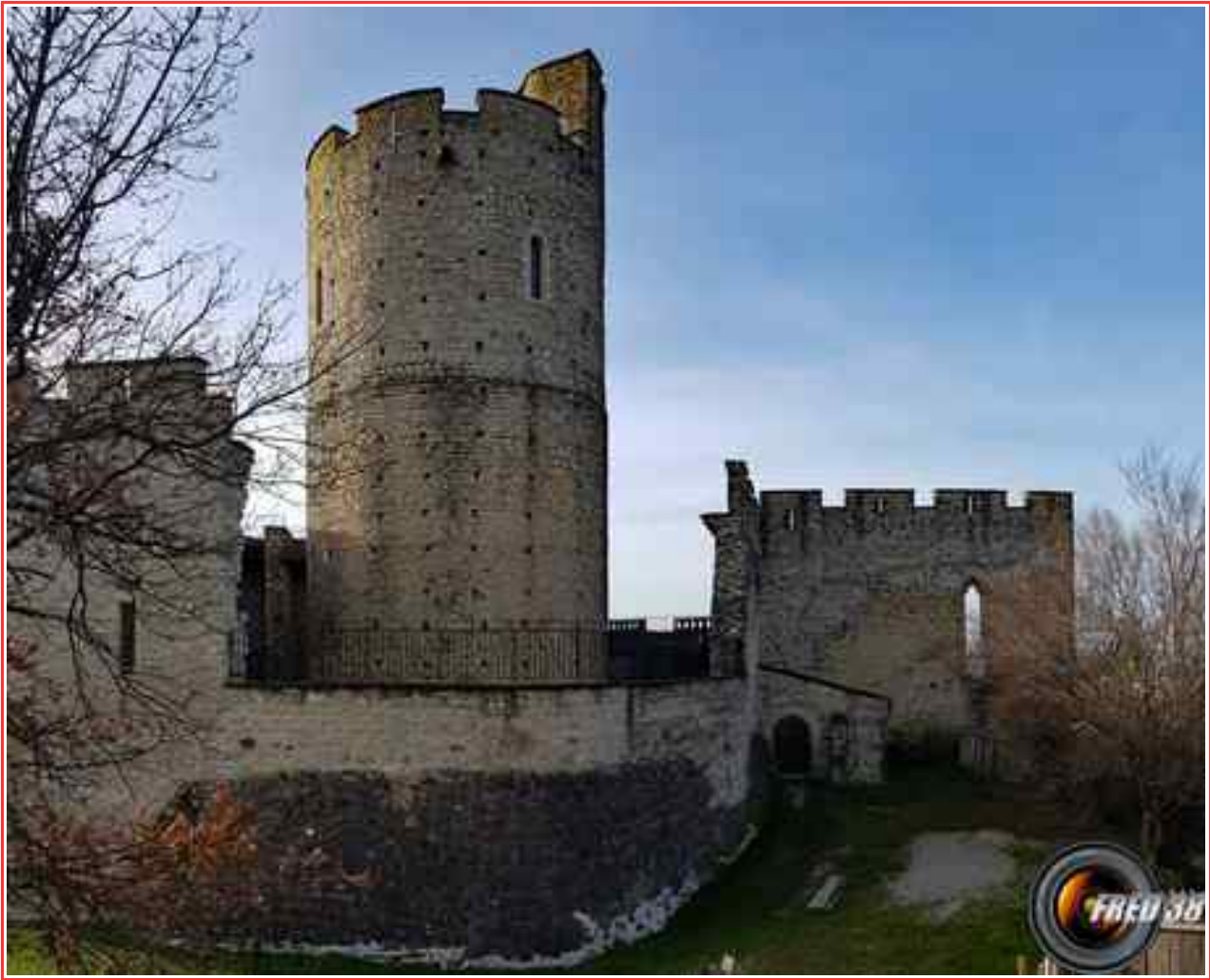
Le château fort..