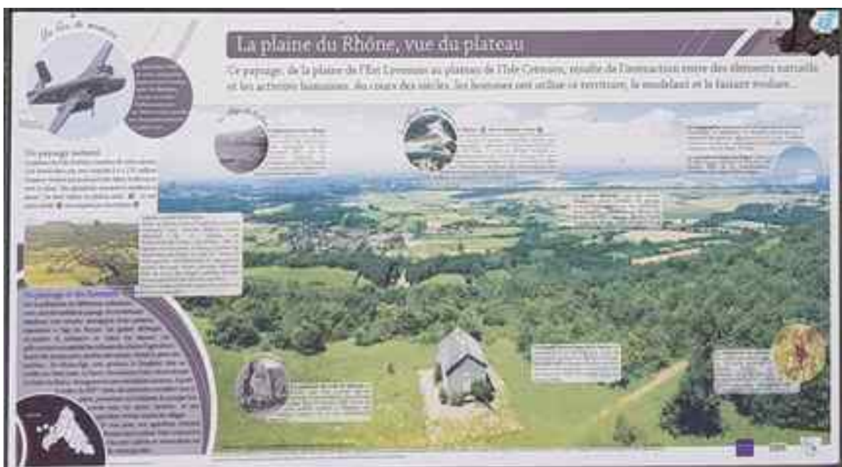
L'étang de la Roche et ses cyprès.

Itinéraire 6 km en boucle dénivelé 210 m.