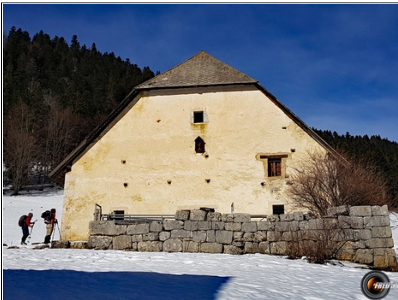
La grande grange.