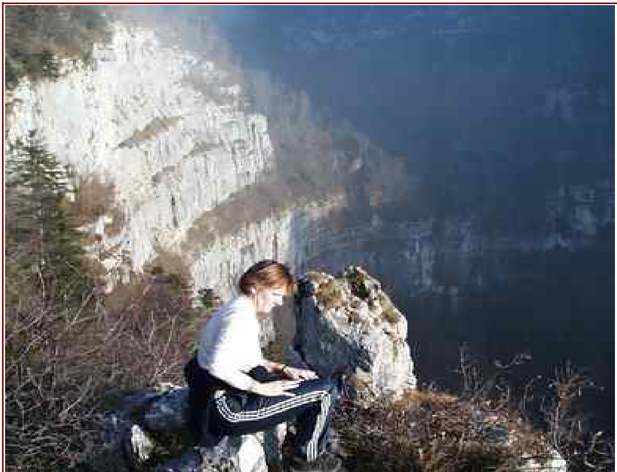
Le cirque de la désolation

Itinéraire : 11 km (a/r) dénivelé : 1257 m.