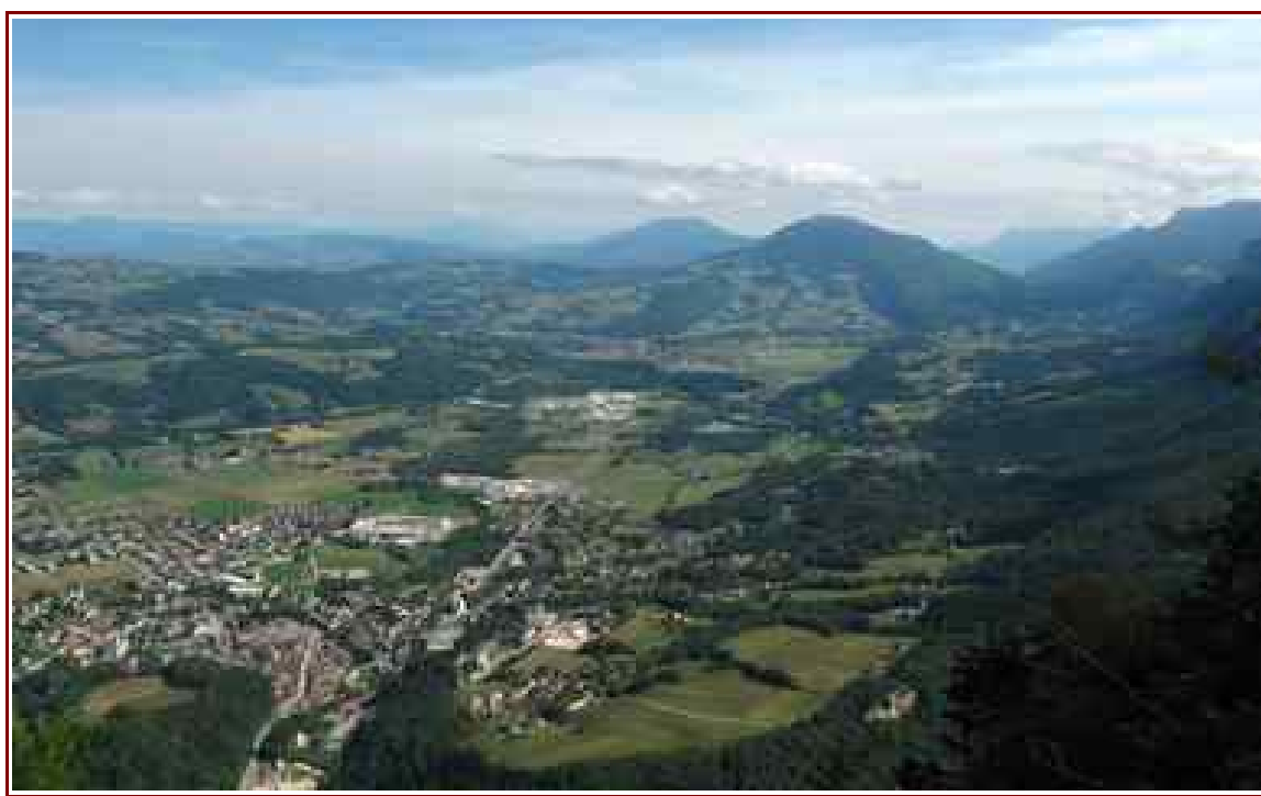
Vue du belvédère de Nonne.