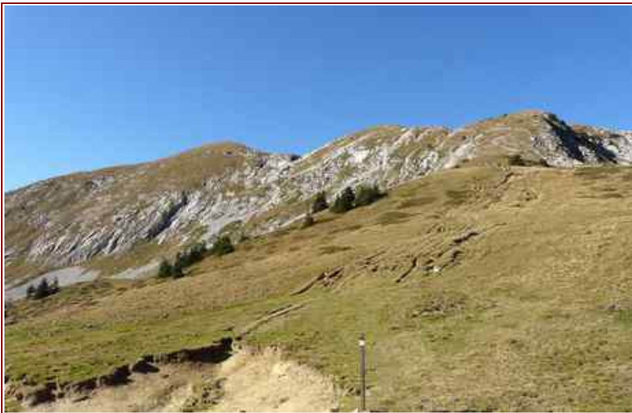
Le sommet vu du col de la Sure