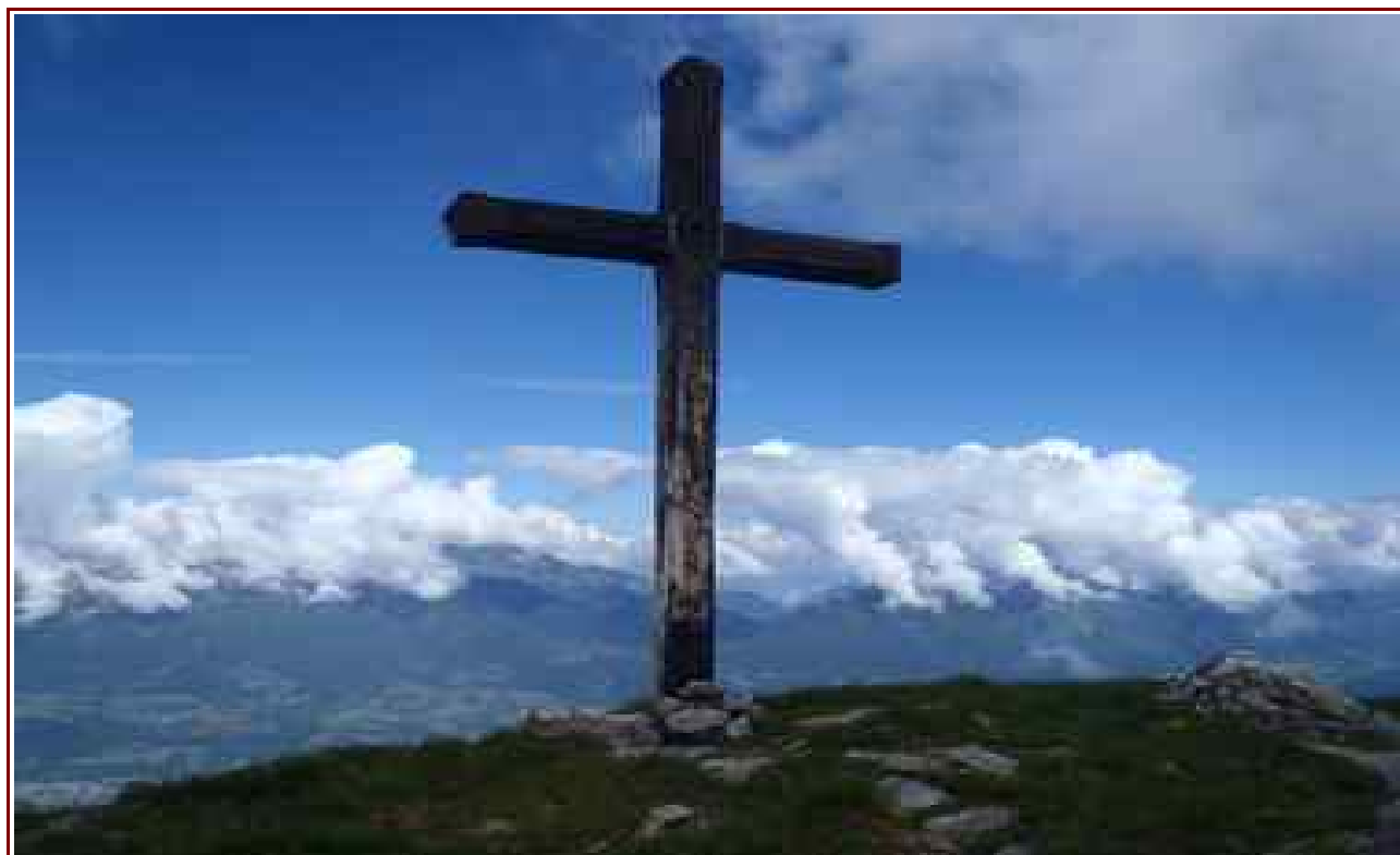
La croix du sommet