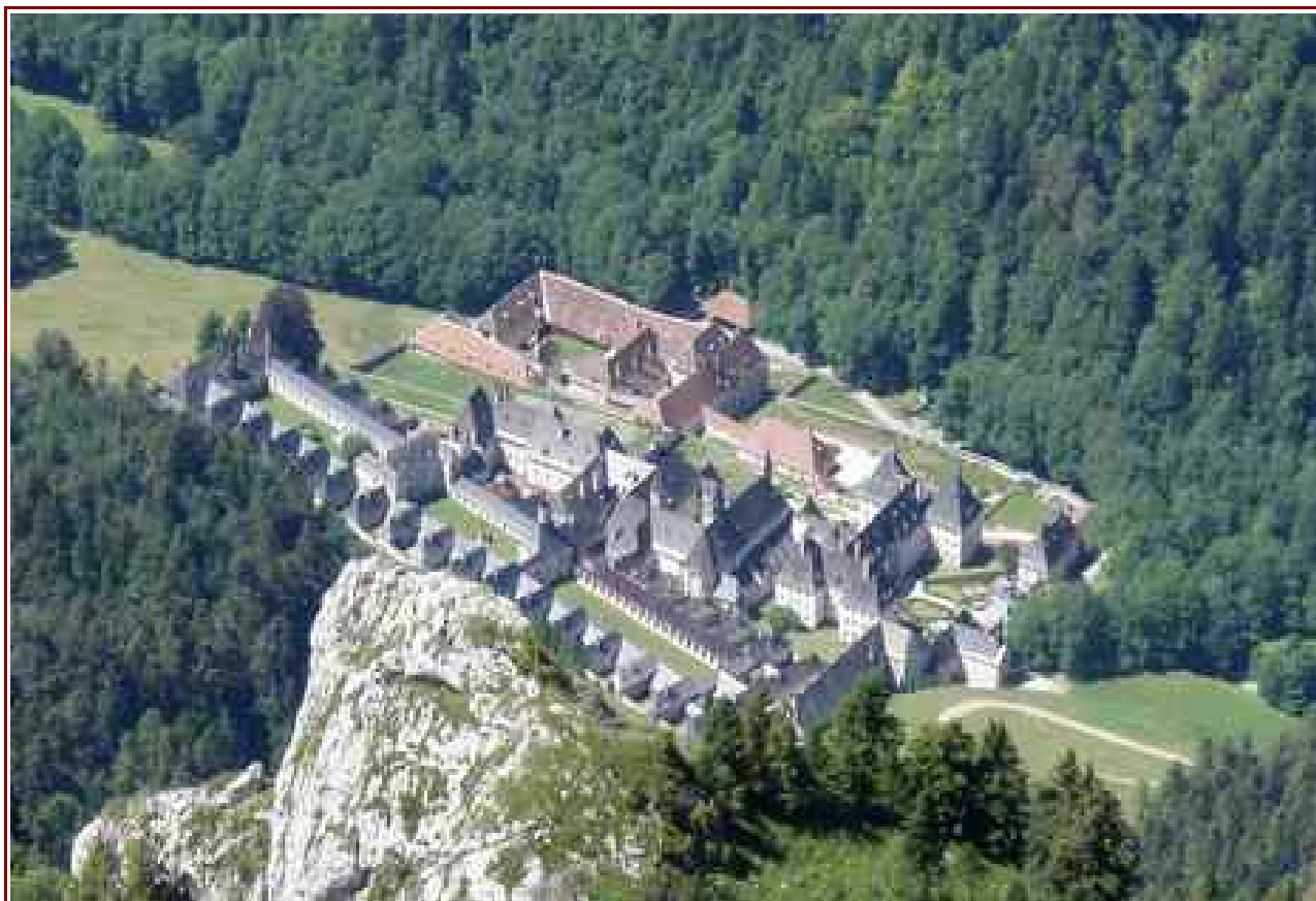
Le couvent de la Grande Chartreuse vu du sommet.