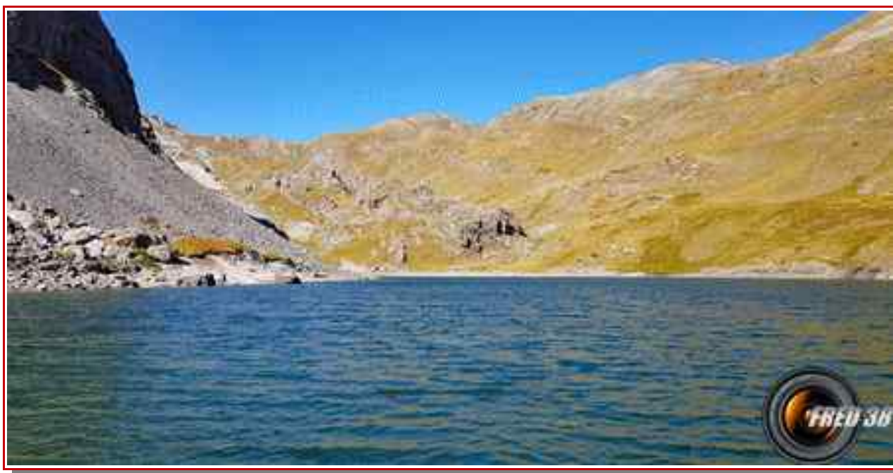
Le Grand Lac