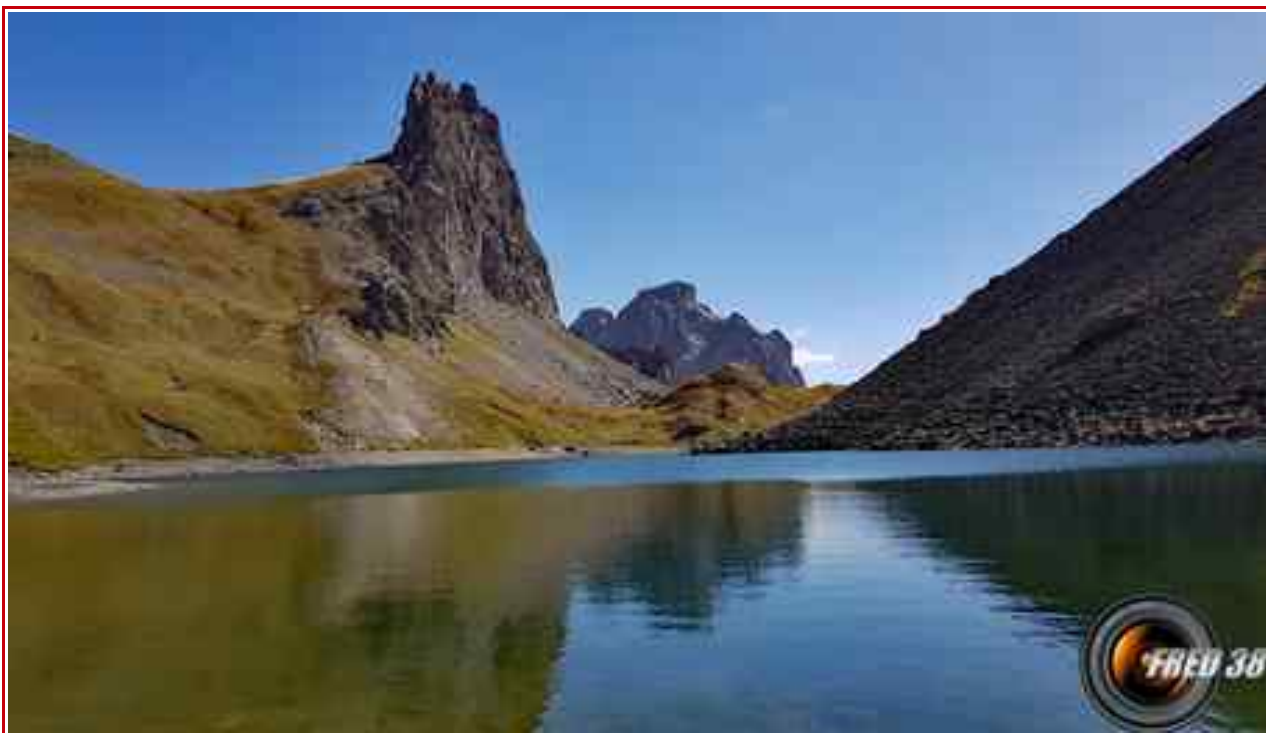
Le Grand Lac et les arêtes de la Bruyère.