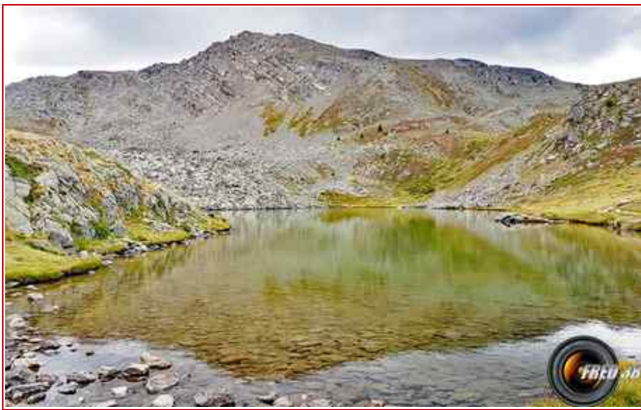
Le Grand lac de l'Oulle..