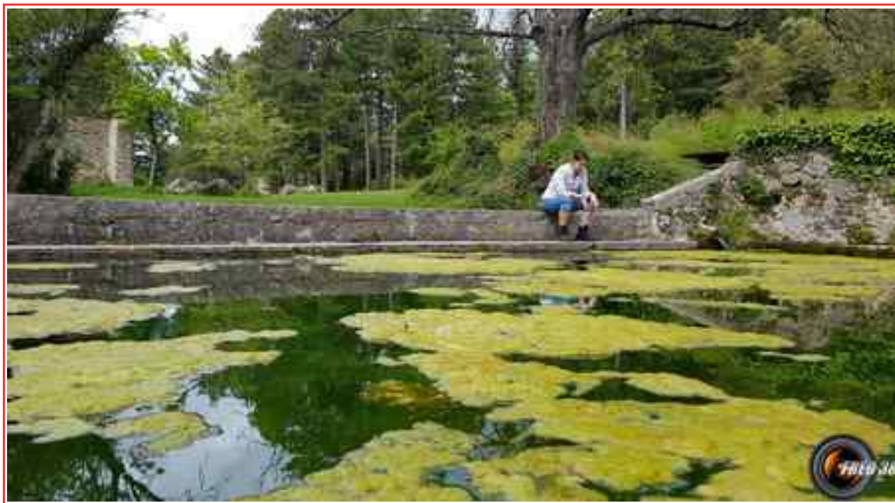
Le grand bassin près du gîte.