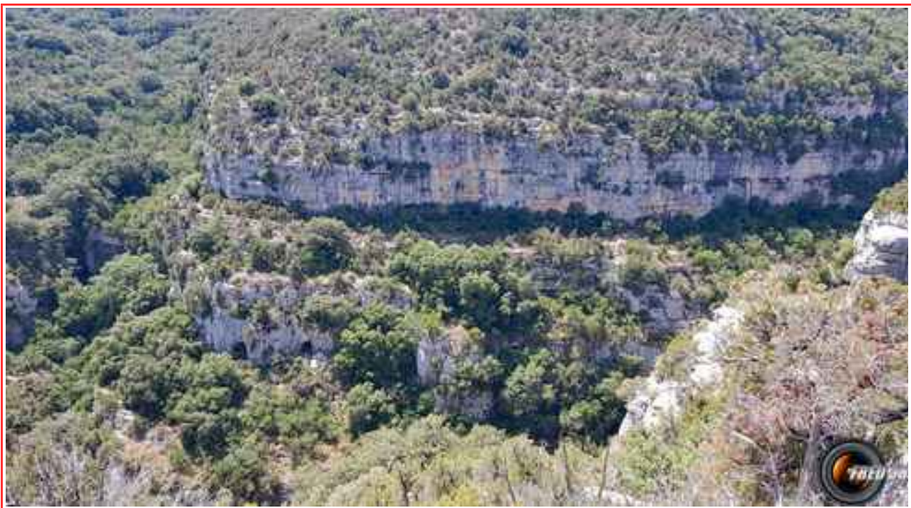
Les Gorges de Baudinard