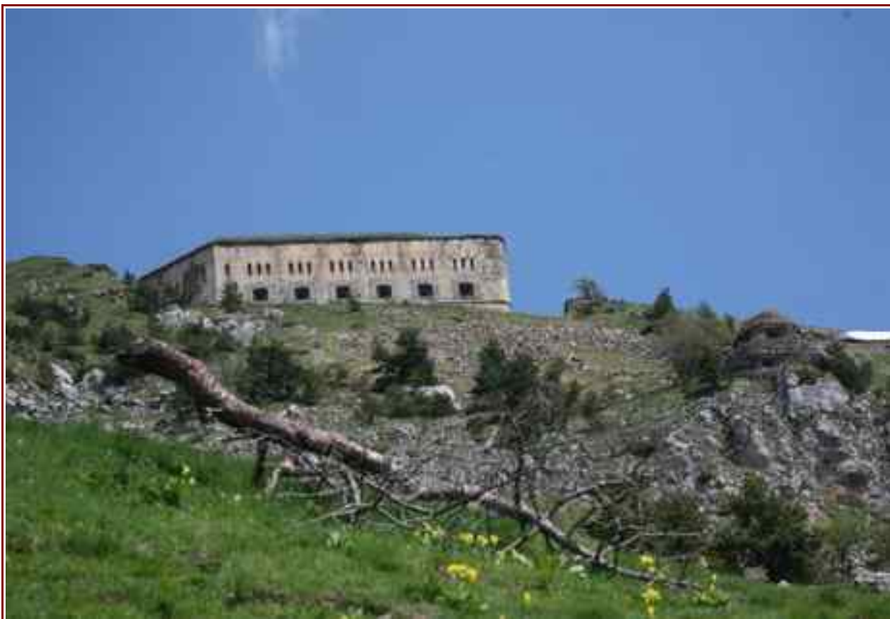
Le fort principal du col de Tende