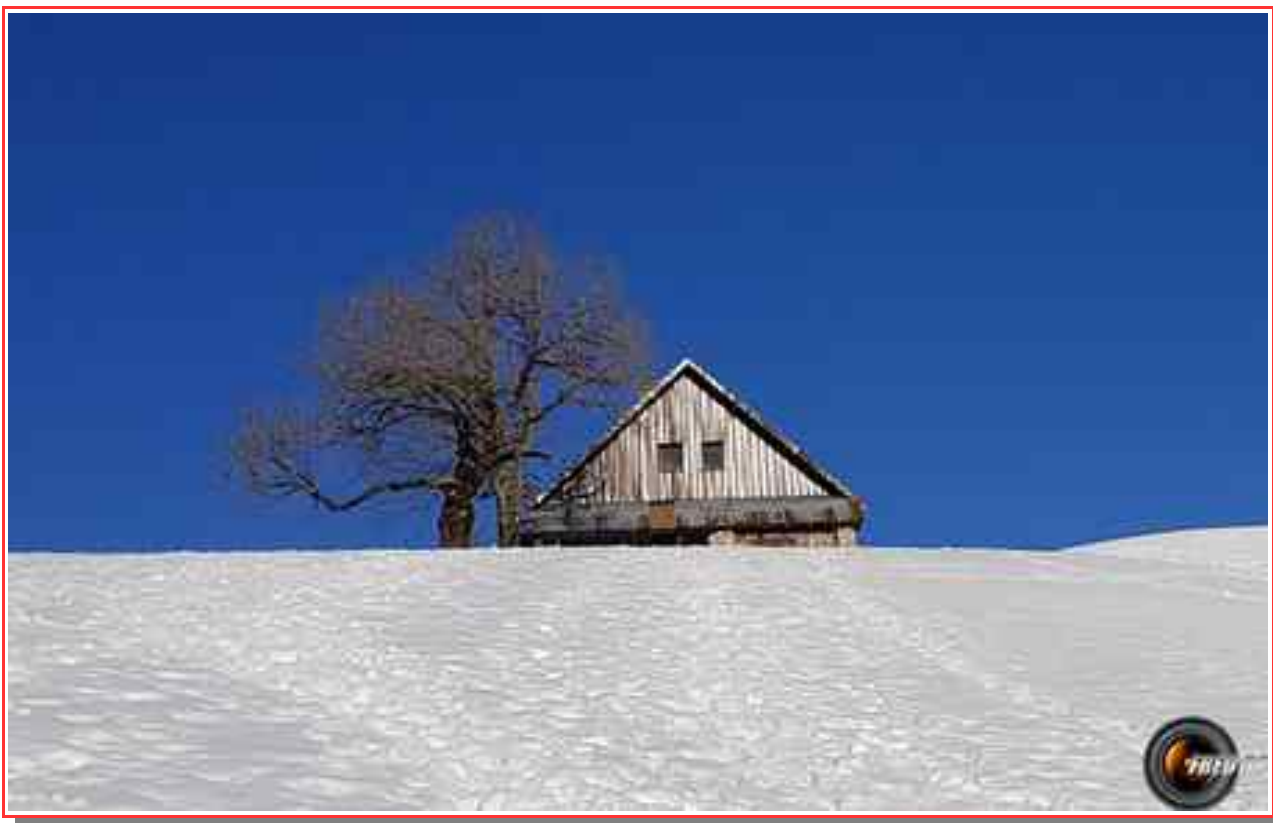
La Grande prairie de l'Emeindras.