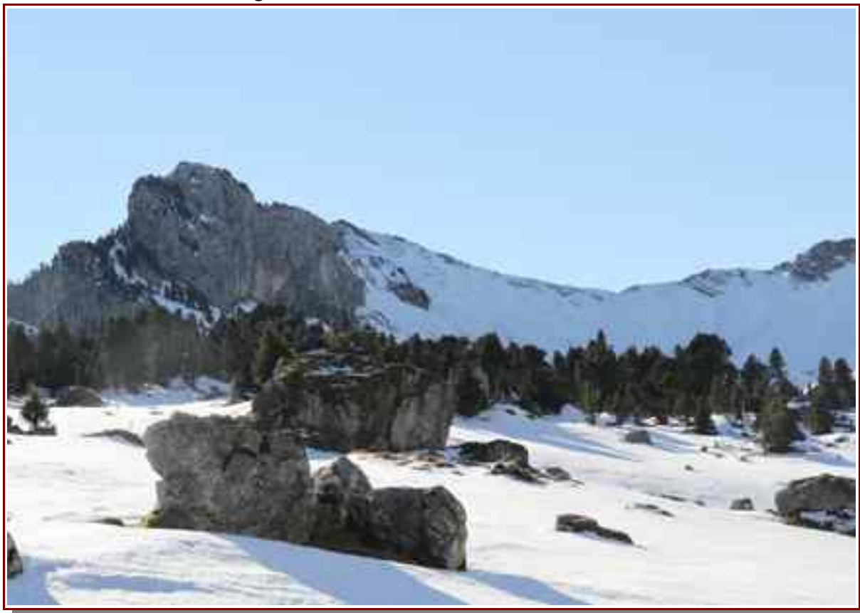
Rochers et col de Bellefont.