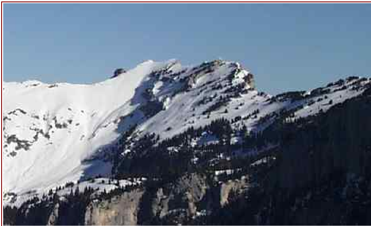
Le sommet vu des Rochers de Fitta