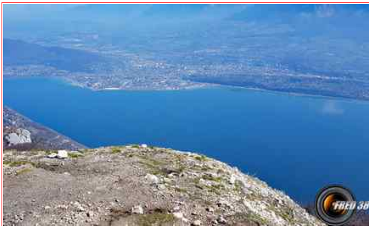
Le lac du Bourget vu du sommet.

— Environ 3,5 km d'itinéraire, pour 809 m de dénivelé positif.