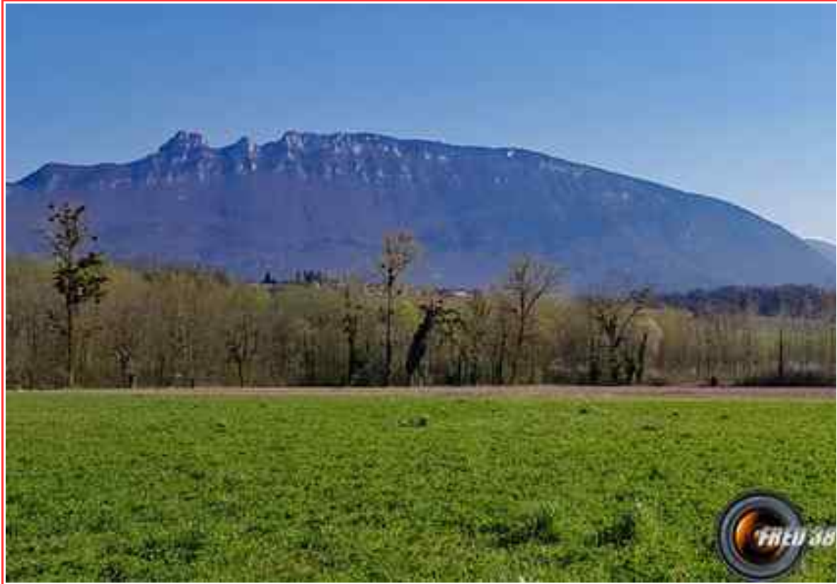
Sommet vu de Yenne.