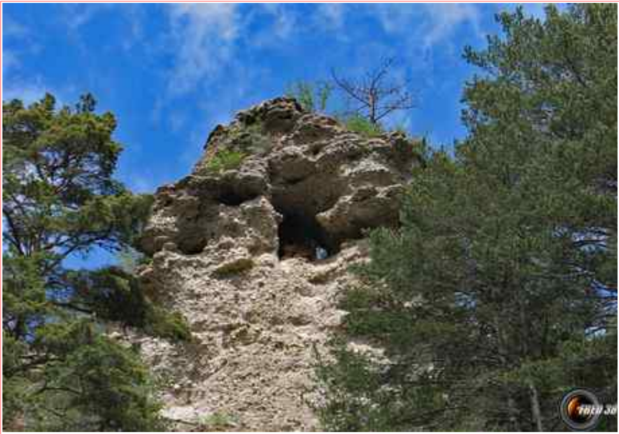
Une des "demoiselles".