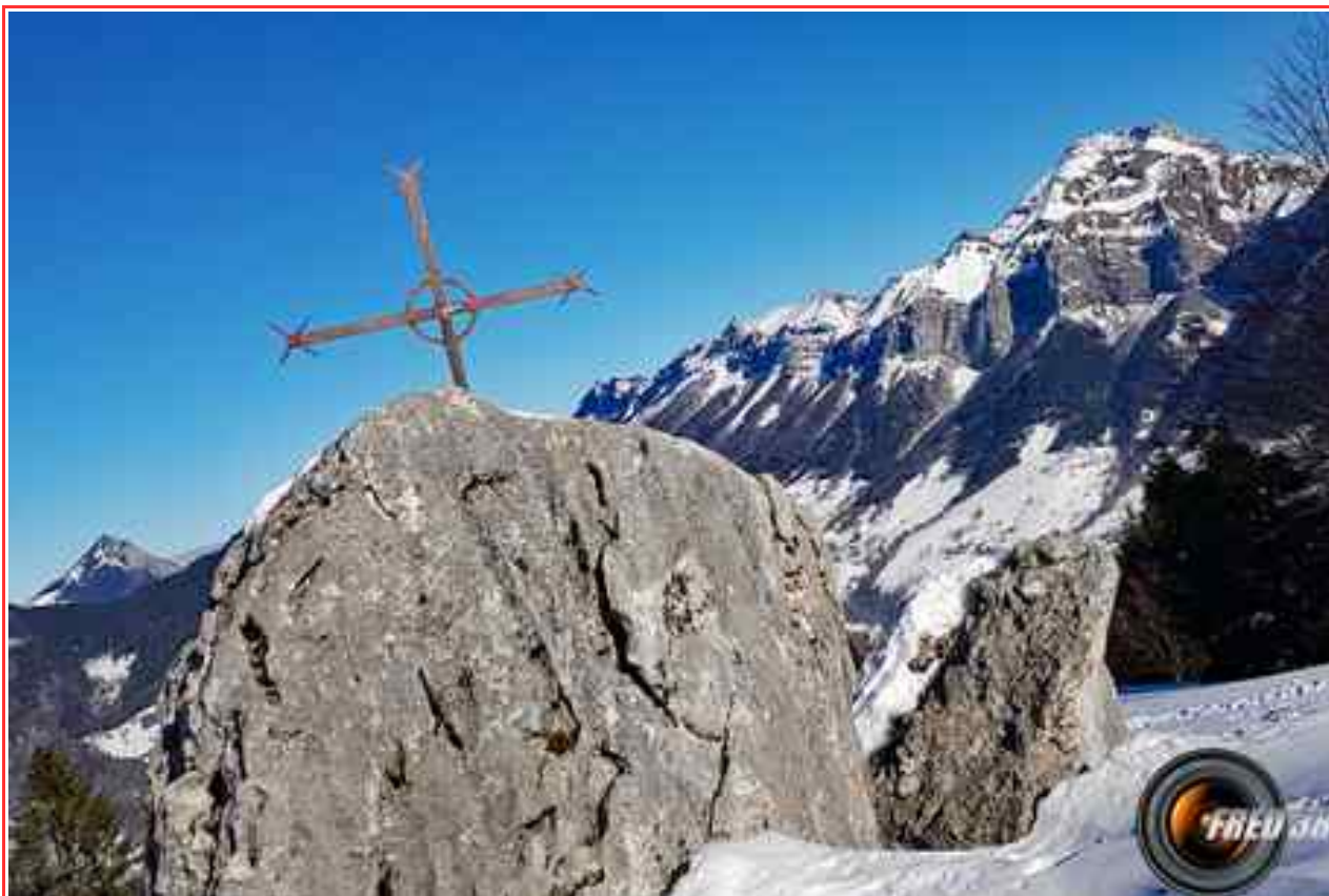
La croix du Plane et en fond l'Arcalod.