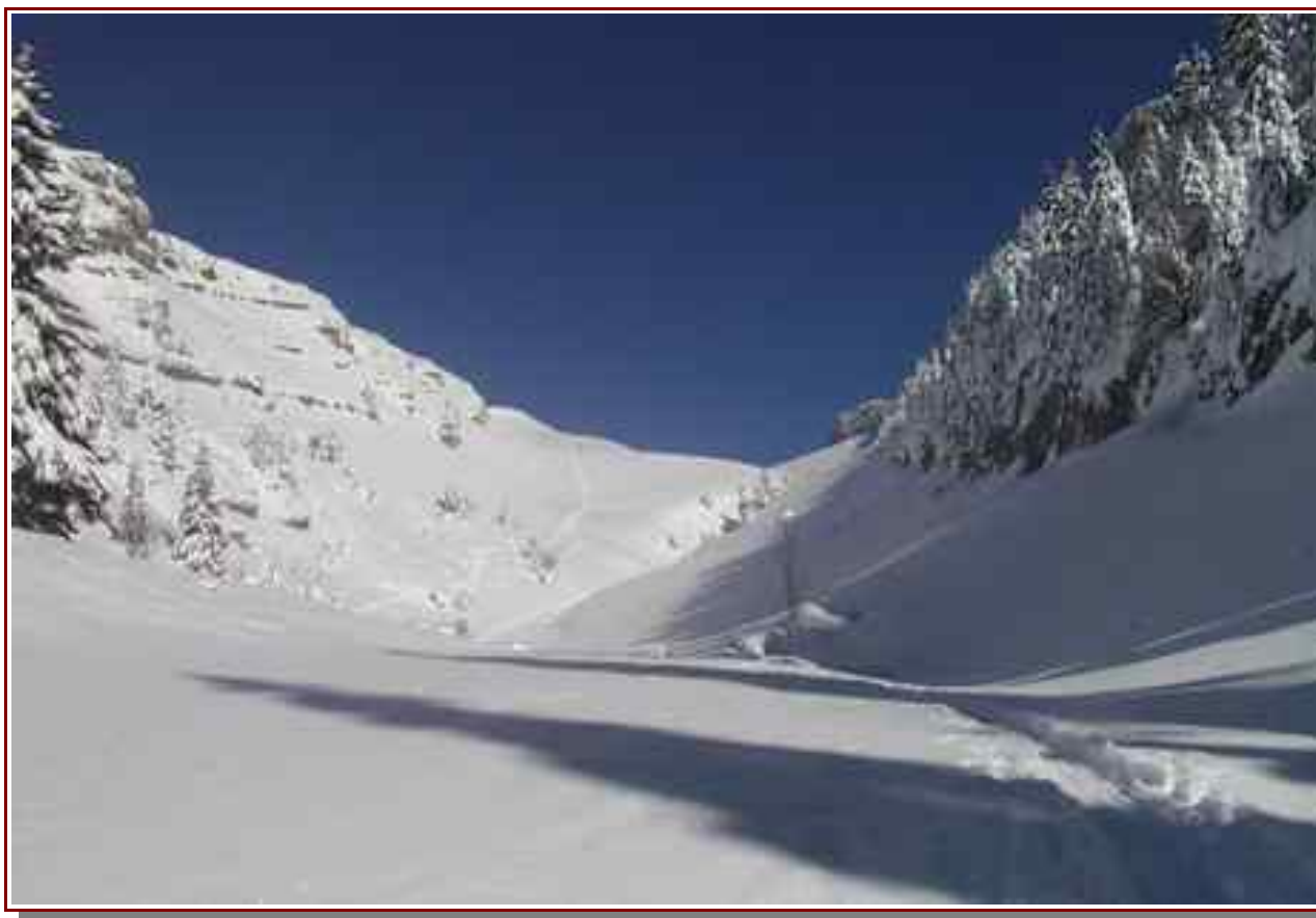
Le vallon de Pratcel et en fond le col de l'Alpes