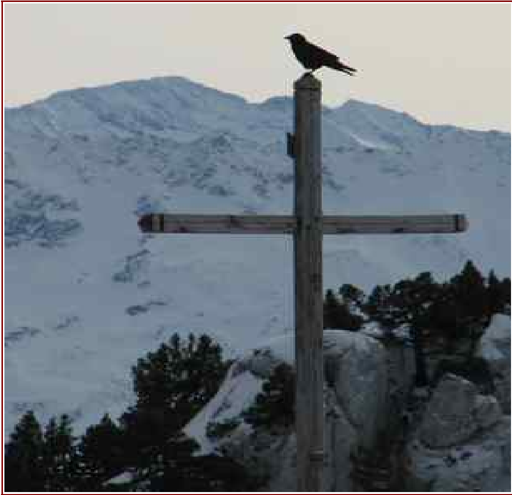
La croix et en fond le massif de Belledonne