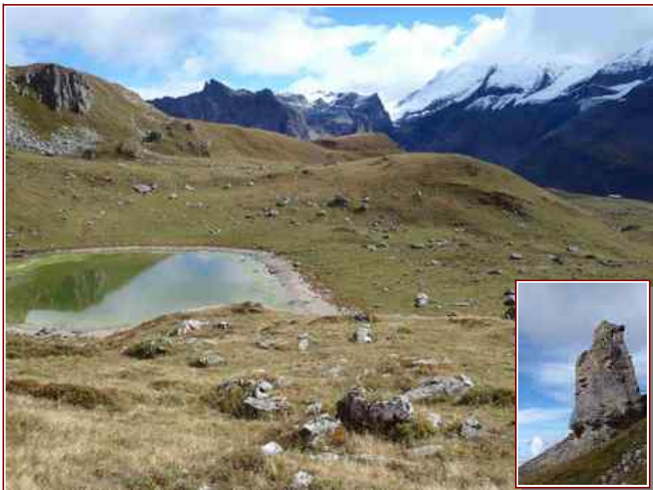
Lac des Échines en montant à la crête