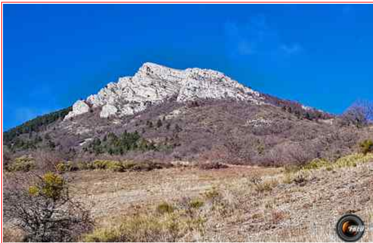
Vue de la piste.

MASSIF : Diois/Baronnies CARTE : IGN 3339 OT