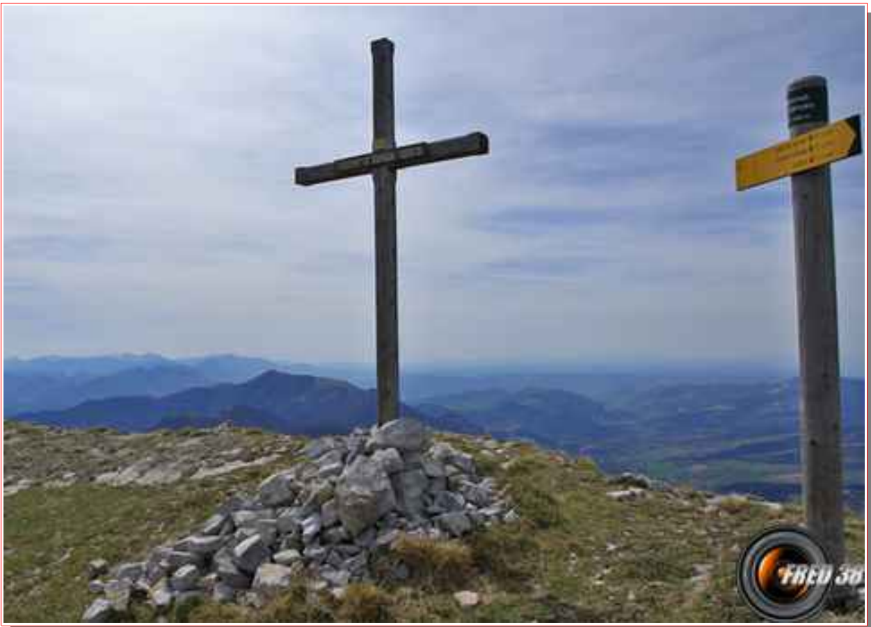
La Croix du sommet.