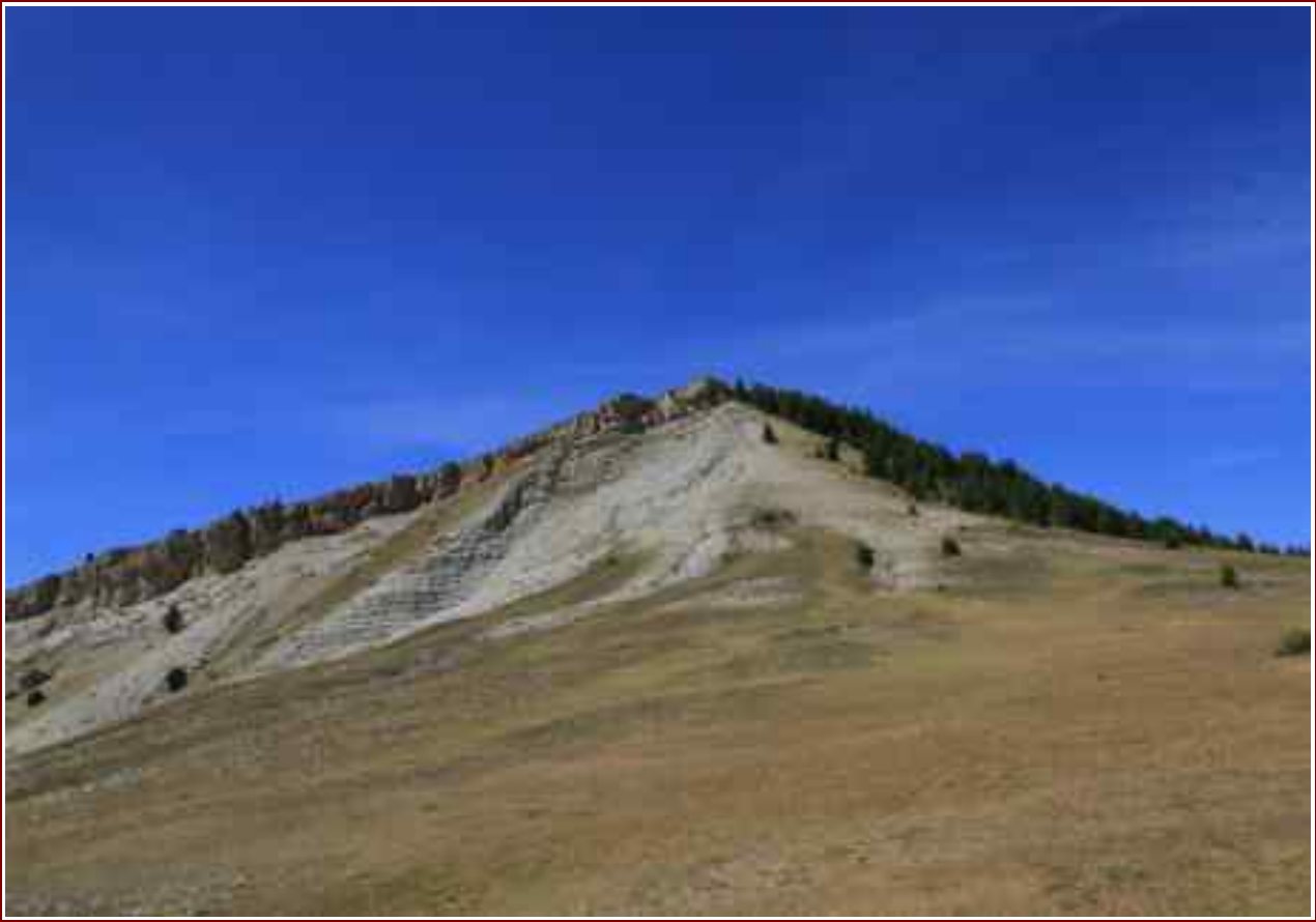
Sommet vu du plan du Rieu