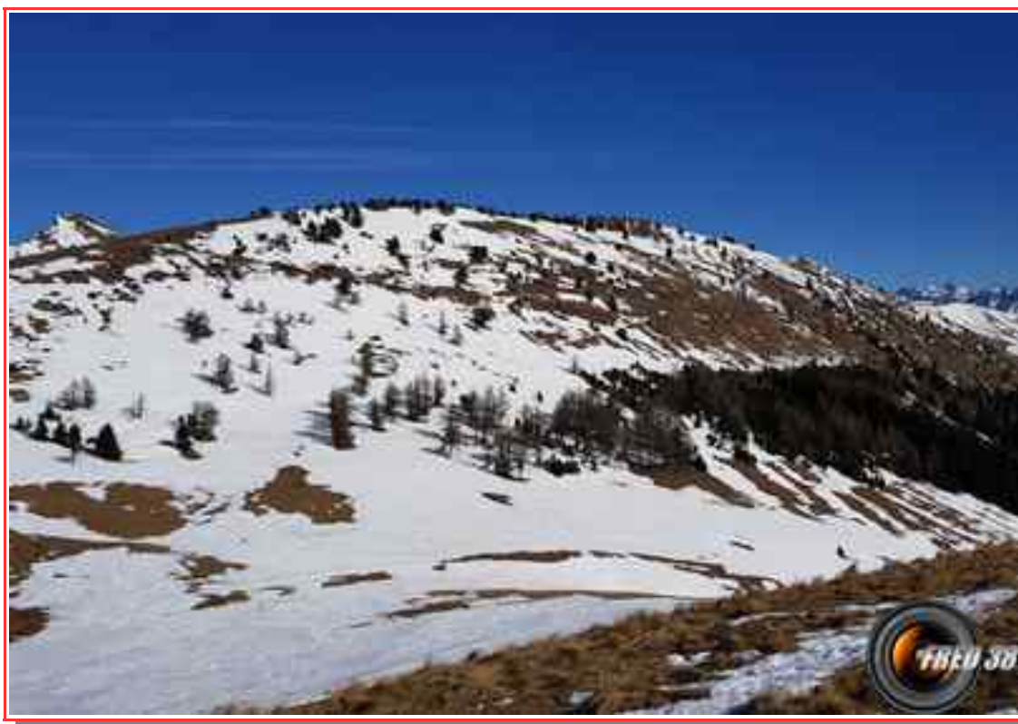
Le sommet vu de Mont de Rouse.