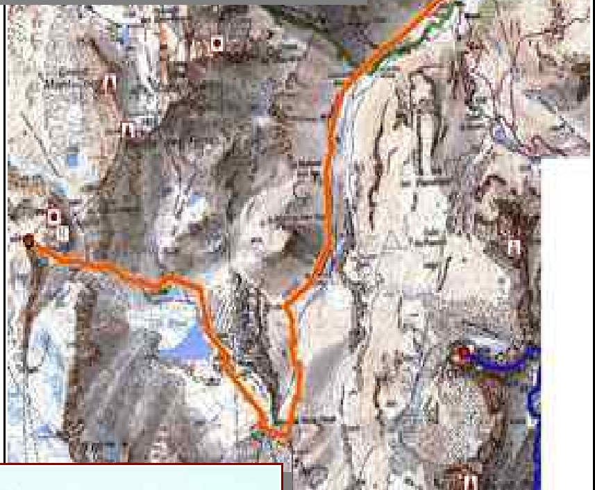
Le col du Soufre