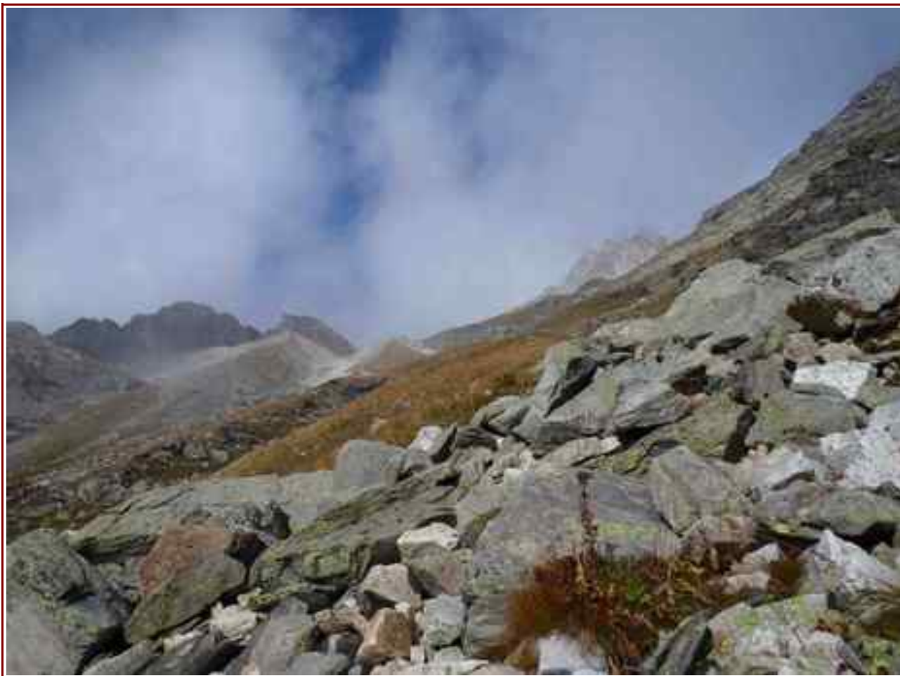
Le col vu du lac Blanc