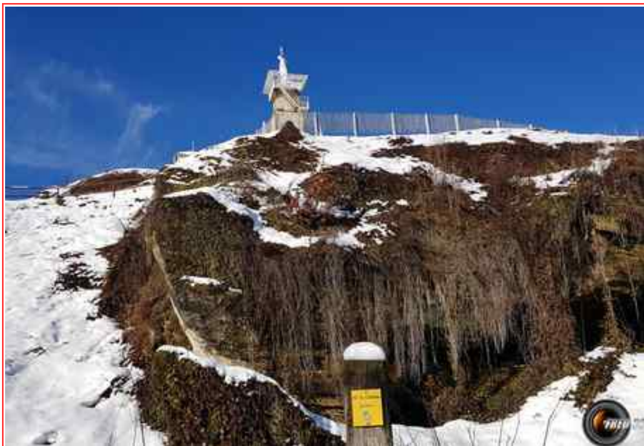
Notre Dame du Château.