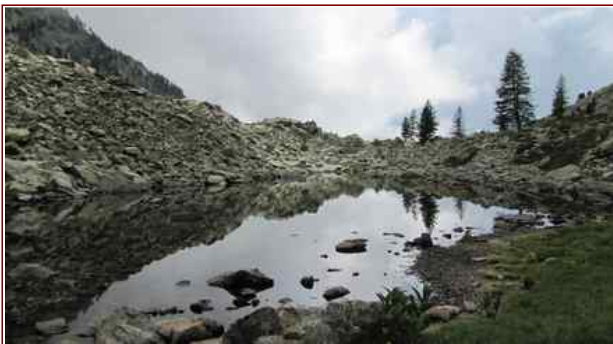
Le lac de Cerise

Itinéraire pour le sommet 6,5 km, 933 m de dénivelé positif.