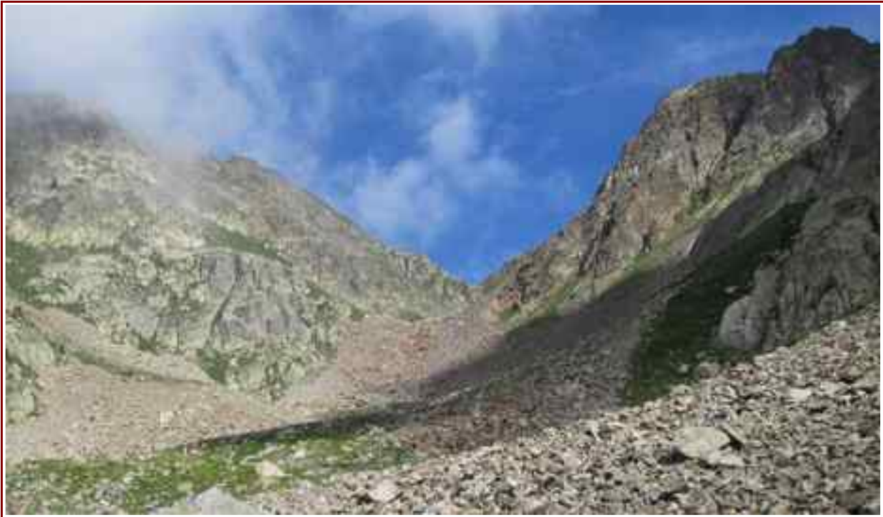
Le col vu de la montée

MASSIF : Mercantour/Vésubie CARTE : IGN 3741 OT