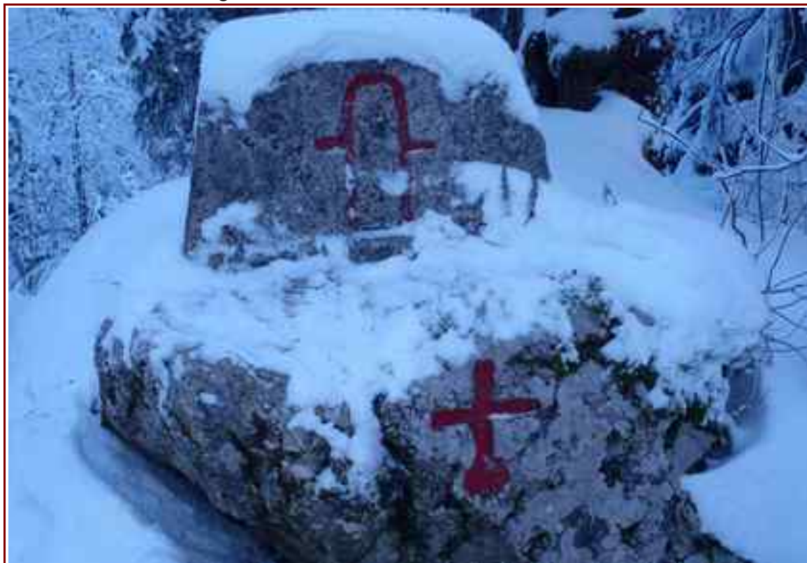
L'oratoire de Nère Fontaine