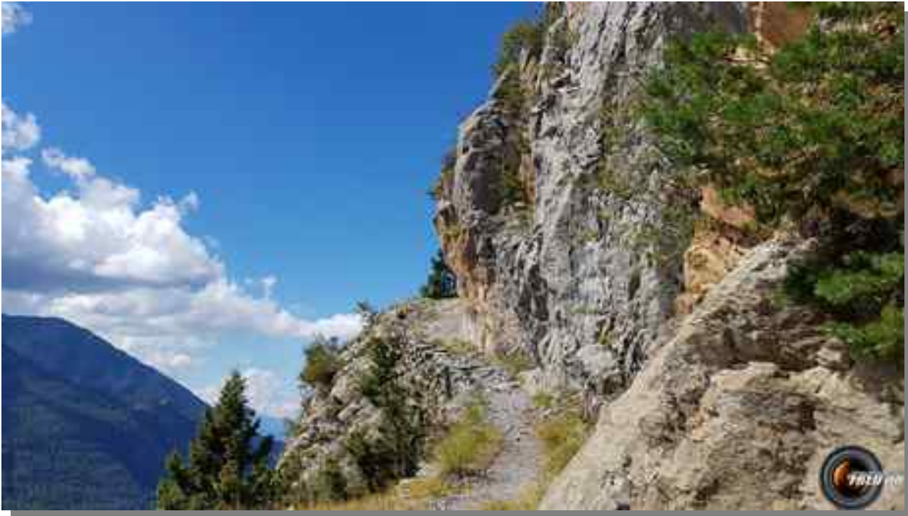
Le sommet vu du lac du Canard