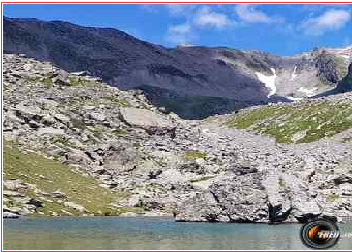
Le sommet au centre, vu des lacs du Vénitier.