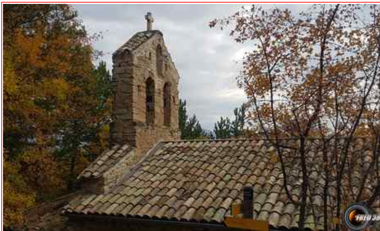
La chapelle Saint-Philippe.

MASSIF : Pré-Alpes de Haute-Provence CARTE : IGN 3440 OT