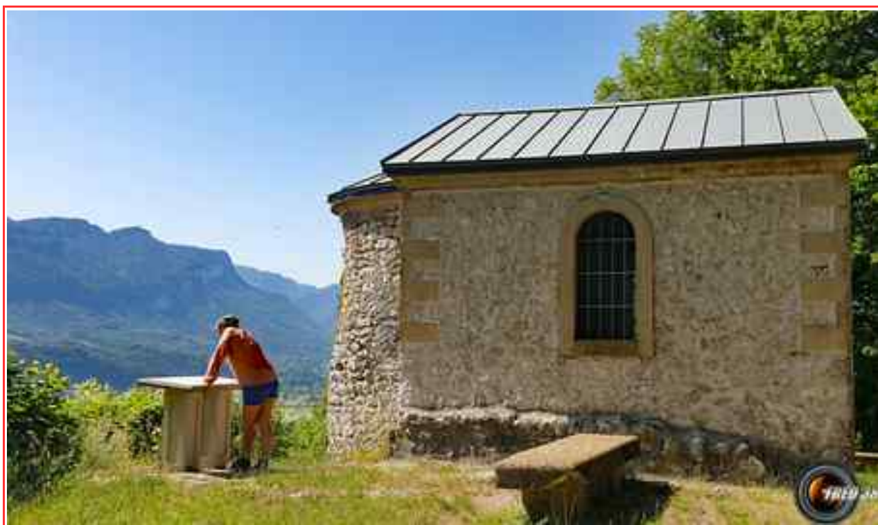
La chapelle de la madeleine.