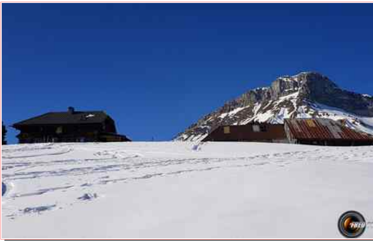
Les chalets et le Mont Colombier.