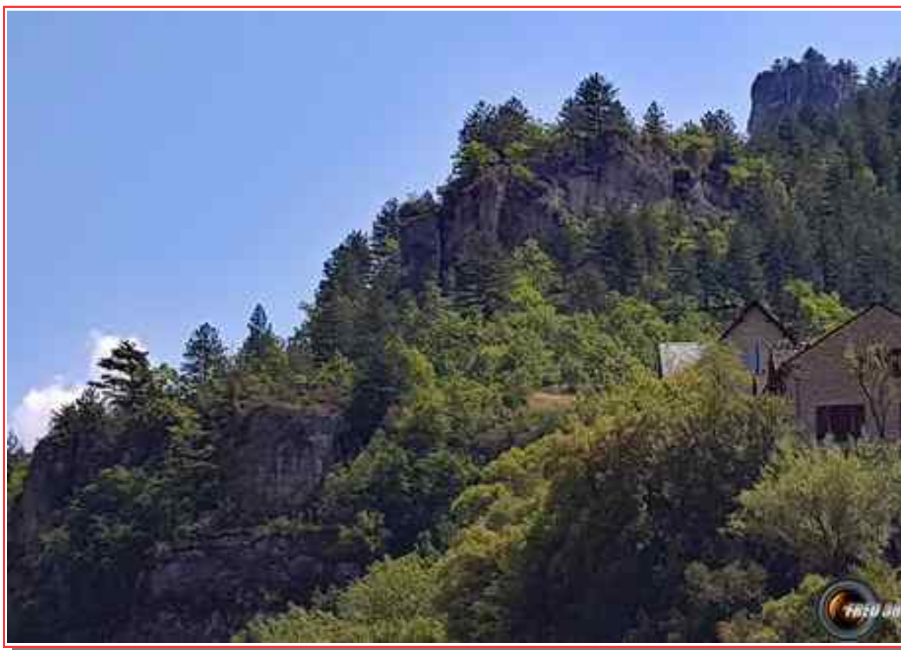
Le rocher des Egoutals.