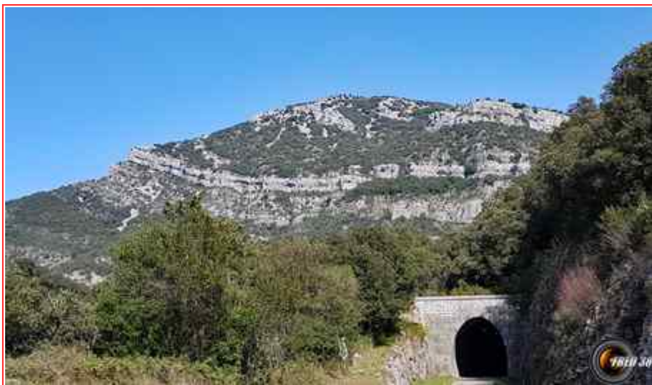
Le Ranc de Banes vu de la voie verte..