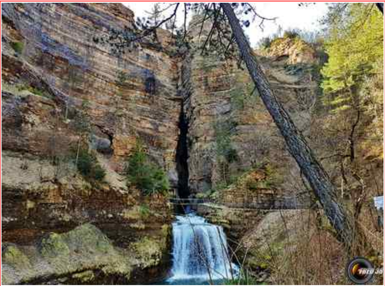
L'église de Saint-Sauveur.