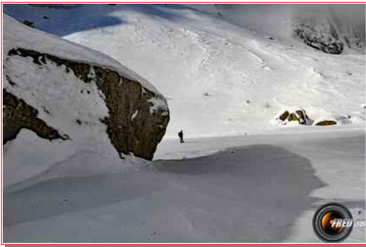
Le gros rocher

Itinéraire pour le sommet 6 km, 250 m de dénivelé positif.