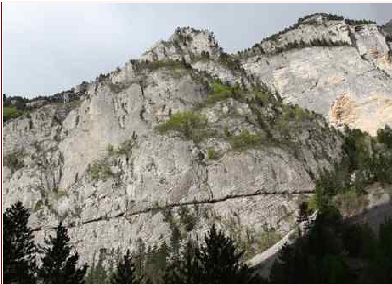
Le canal dans son passage en falaise