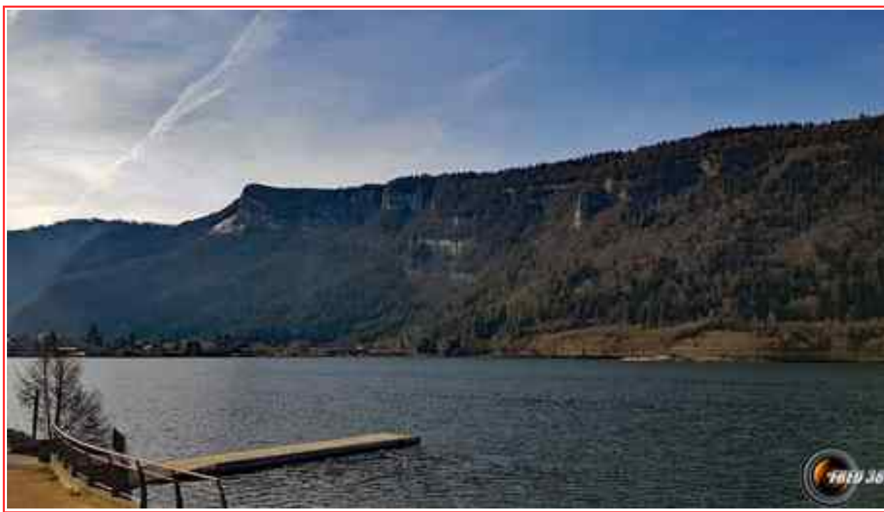
Le sommet vu du lac de Nantua.