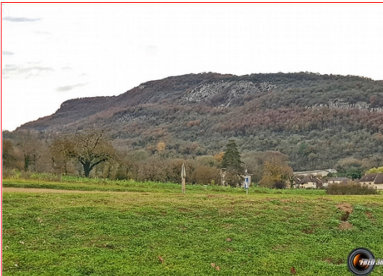
Vue de Murs et Gélignieux.