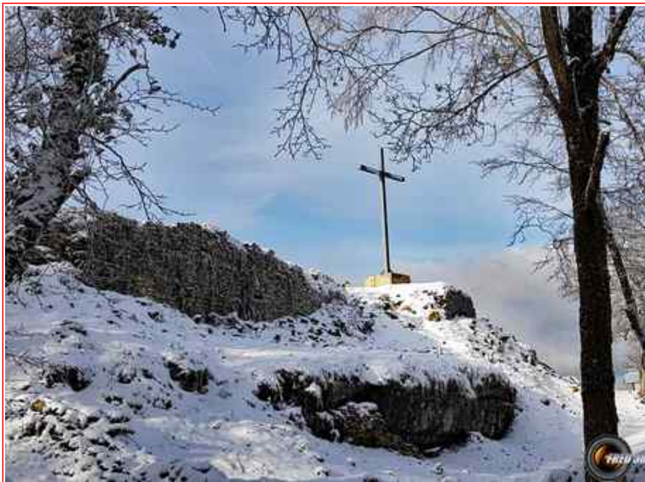
Les ruines du sommet