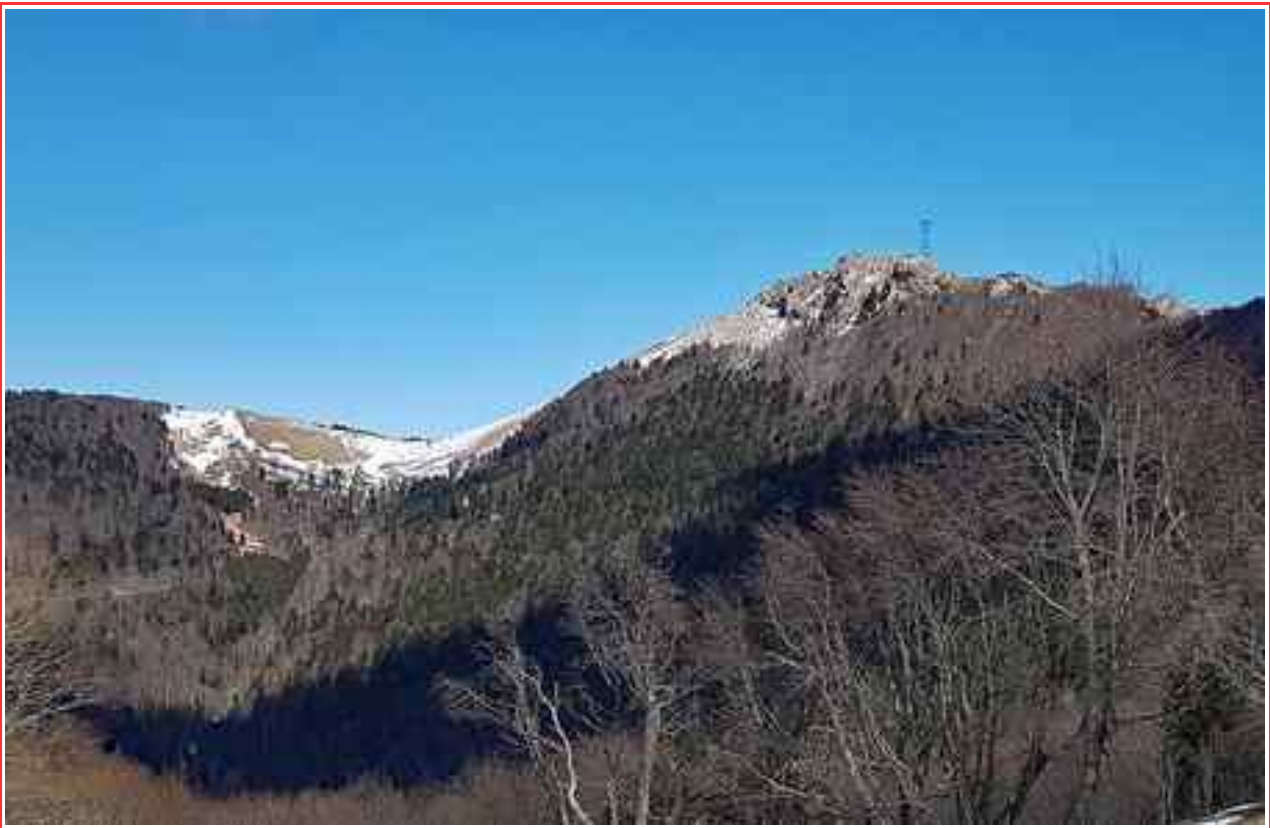
Le sommet vu de Chanduraz.