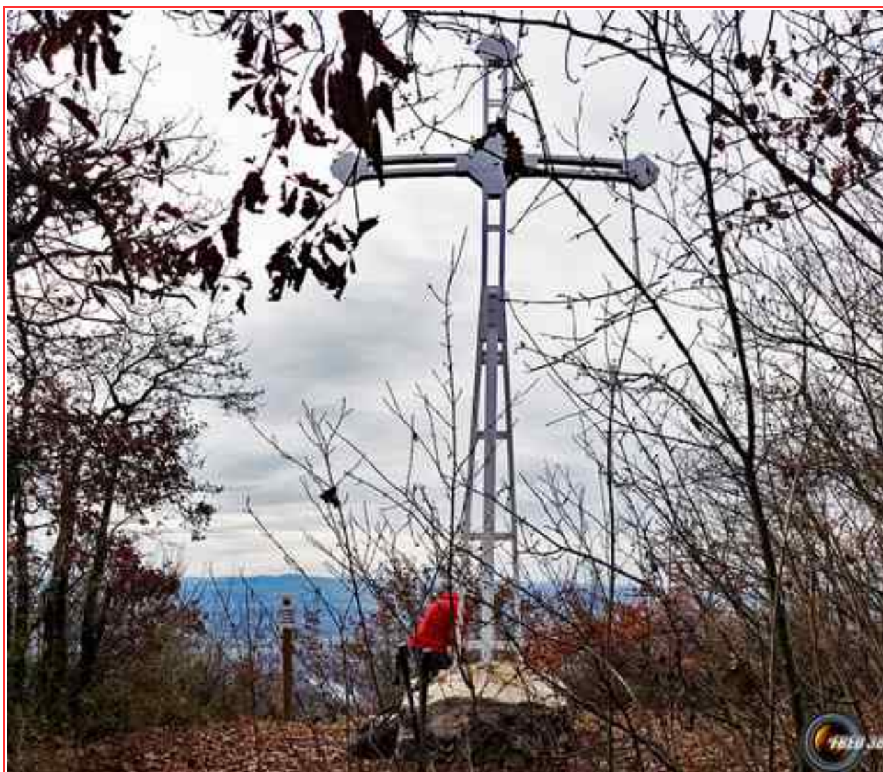
La grande croix du sommet.