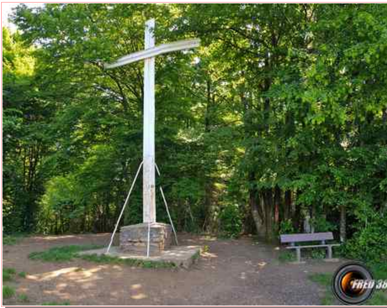
La grande croix métallique