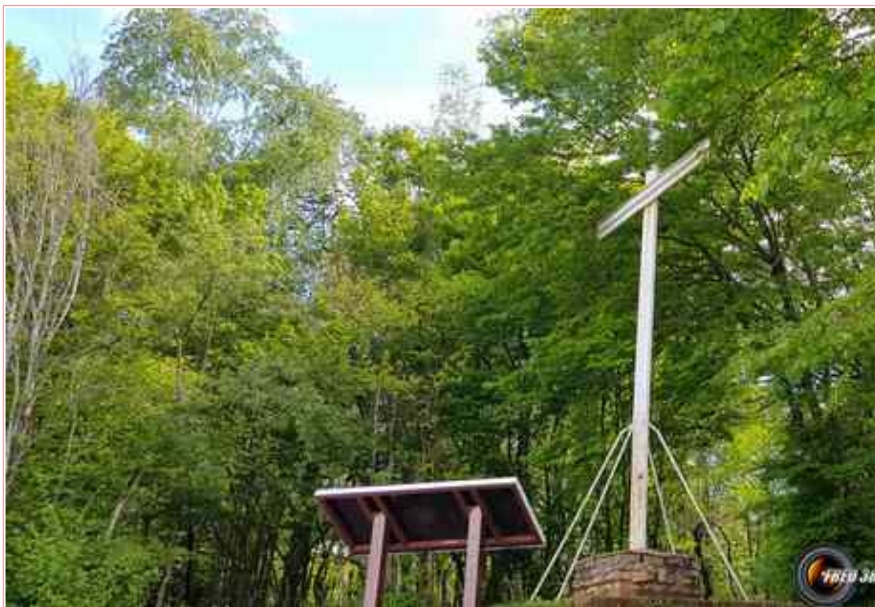
La grande croix métallique.